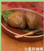
ぽろたん グラッセ